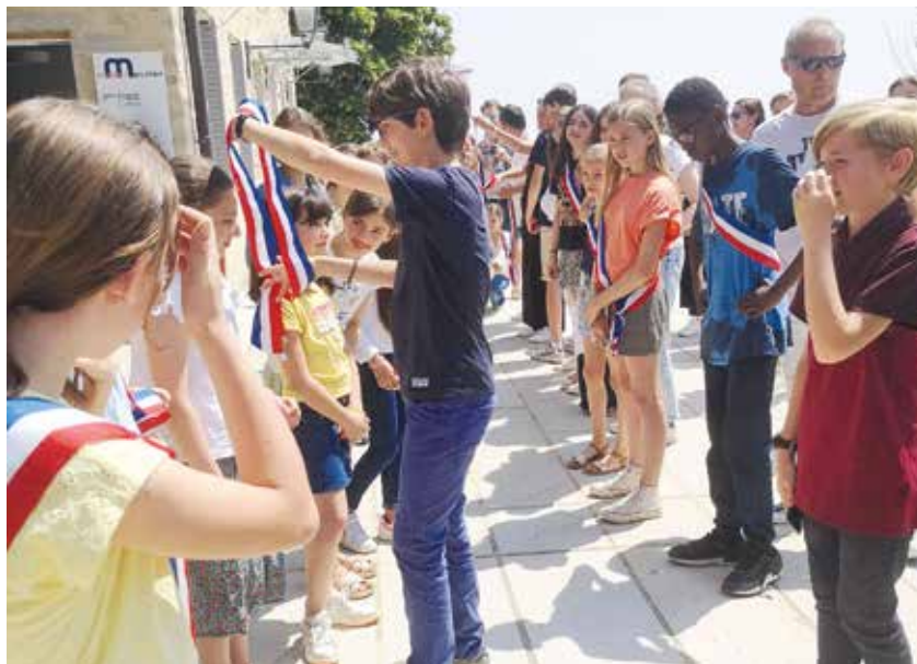
Passation entre l'ancien et le nouveau CME

►► Elus pour deux ans, les membres du conseil municipal d'enfants (CME) proposent, débattent et mettent en place leurs idées pour améliorer la vie des habitants de la commune. Ce programme constitue un premier pas important pour les initier à la démocratie et à la citoyenneté.