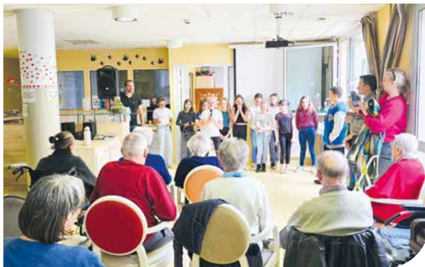
Le CME en visite à l'Ehpad

►► Avec des projets concrets et des débats enrichissants, le CME donne aux jeunes la possibilité de s'exprimer et de devenir des citoyens actifs et responsables.