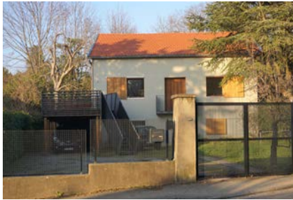
▲ Rénovation d'une maison et de sa clôture, Sainte-Foy-lès-Lyon (69)