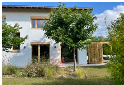
Maison basse énergie, Lucenay (69), Fabien Perret et associés