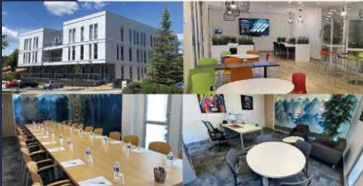
Centre d'Affaires Lyon Monts d'Or 11 rue de la Voie Lactée - 69370 Saint-Didier-au-Mont-d'Or

04 72 53 17 60 - hello@nid-or.fr www.nid-or.fr